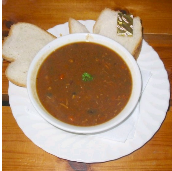
des pais au fou