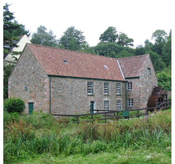
lé Moulîn d'Tchétivé