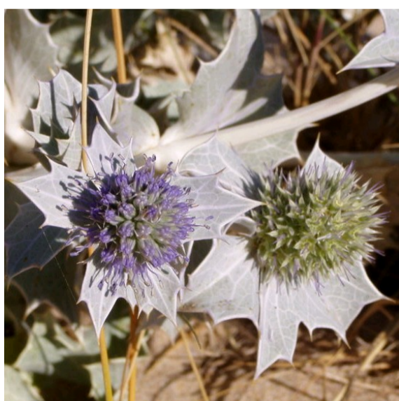
du housse dé mielle