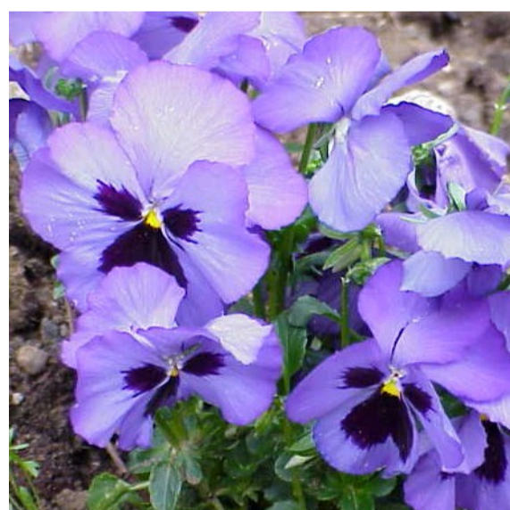
des faches dé cat