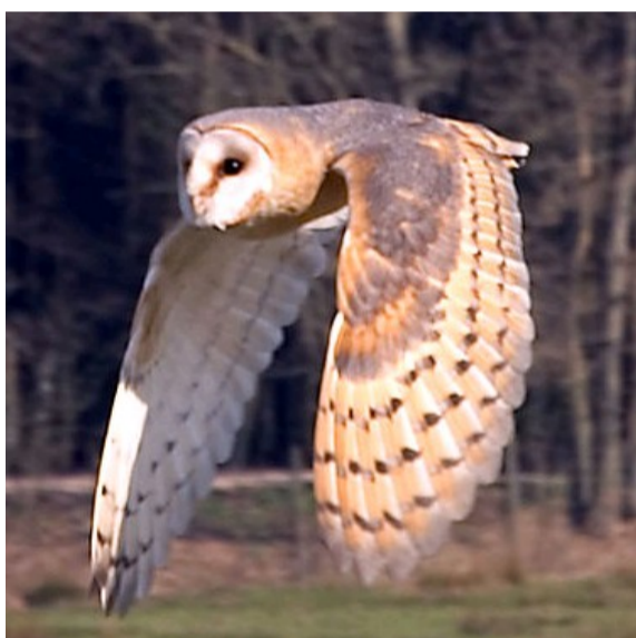
un bianc cahouain