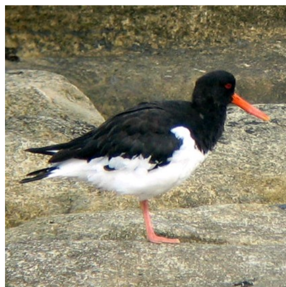
eune pie mathante